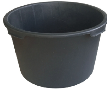
Mischkübel 90 Liter

Technik für die Bausanierung - Engineering for building renovation